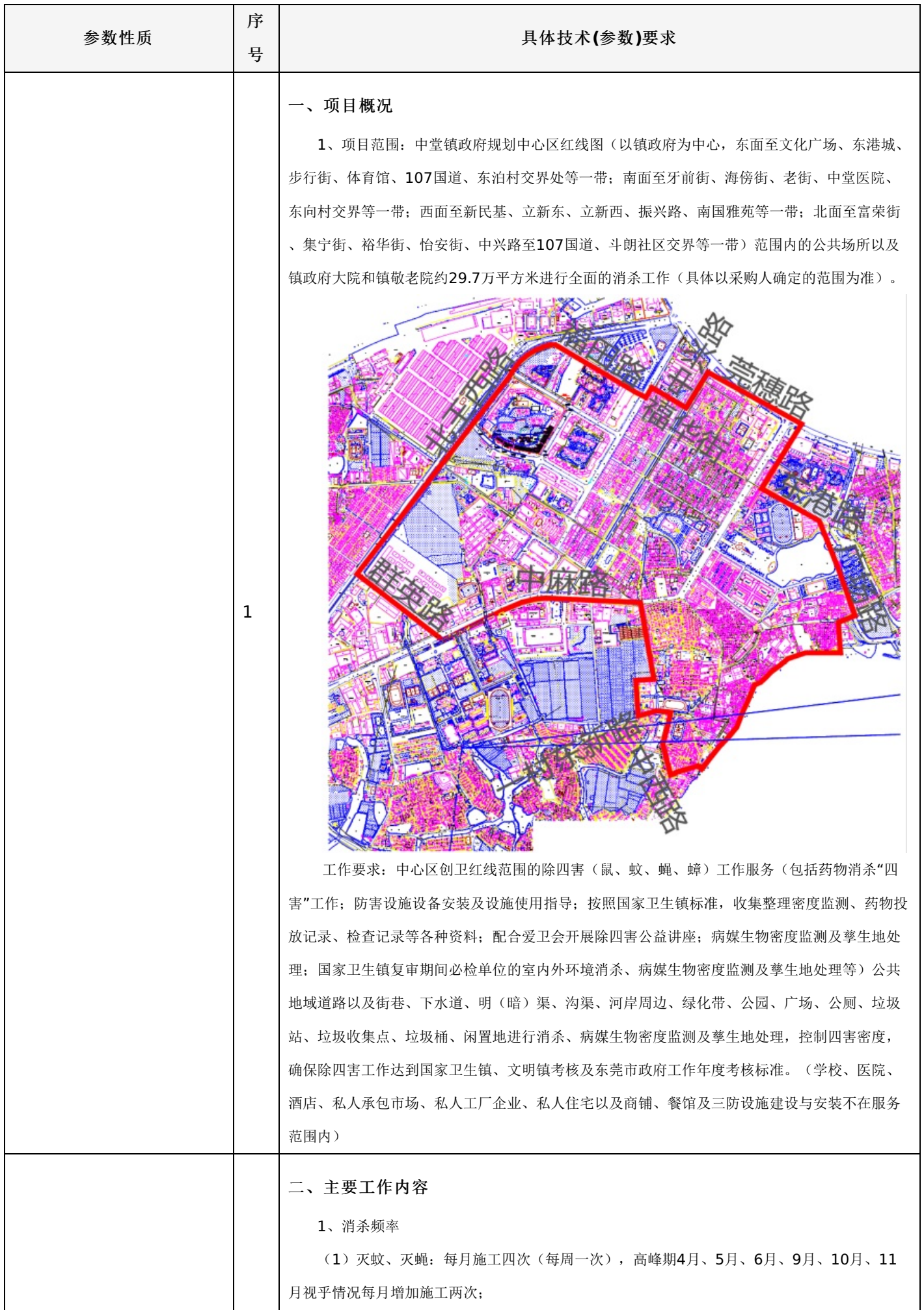
附表一：中堂镇中心区公共环境除“四害”服务项目